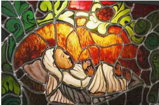
le vitrail de Charles Carrère